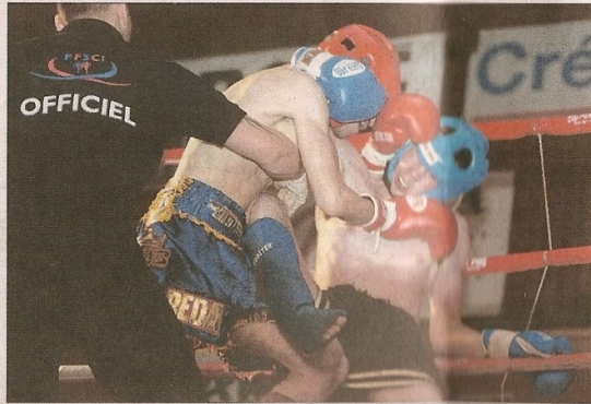
Le hasard joue avec les nerfs des combattants : le tirage au sort a désigné des 1/4 de finale qui devraient être très serrés.